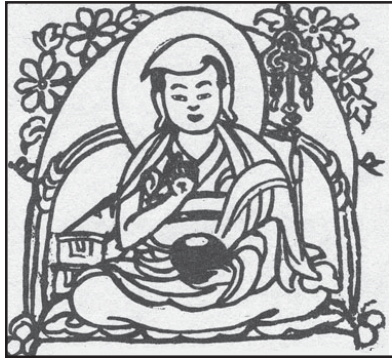
༤ རྩོམ་པ་ལ་འཛིན་པ་དཔལ་ལྷན་བཟང་པོ།