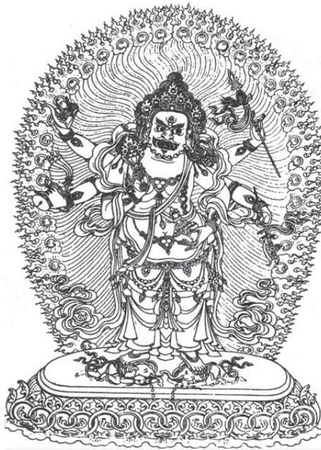
མགོན་དཀར་ཡིད་བཞིན་ཚོར་བ།