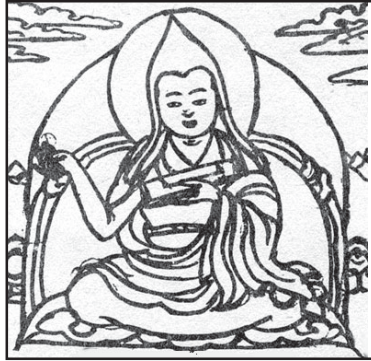
མ རྒྱུད་ཚེན་དགོན་མཚོག་ཡར་འཕེལ།