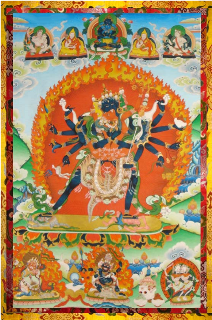
ཕ དཔལ་འཁོར་ལོ་བདེ་མཚོག་ལུ་ཨི་པའི་ སྤྱི་བར་བཞུགས་སོ།