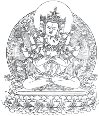
༘ དཔལ་གསང་བ་འདུས་པ།

༡༡། །དཔལ་ལྷན་སྒྲུང་གྲུ་ཚང་གི་ཕྱག་ལེན་ལས་ དཔལ་གསང་བ་འདུས་པའི་ལས་རུང་གི་བསྟེན་བྱ་ཚུལ་ མཁས་པའི་ཞལ་རྒྱན་གང་དུན་བརྗོད་ཐོར་བཀོད་པ་ བཞུགས་སོ།།