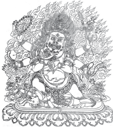
༘ ལྷུར་མཛད་ཡི་ཤེས་མགོན་པོ།

༄༅། །གསང་ཚེན་དཔལ་ལྷན་སྤྱད་རྒྱུད་གྲུ་ཚང་གི་ཕྱག་ ལེན་དཔལ་ལྷུར་མཛད་ཡི་ཤེས་ཀྱི་མགོན་པོ་ཕྱག་རྒྱལ་པའི་ གཏོར་རྒྱུབ་ཀྱི་ཚོ་ག་བཀོད་པ་བཞུགས་སོ།།