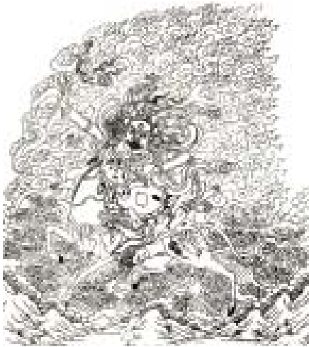
ཕ་མ་གཅིག་དཔལ་ལྷན་ལྷ་མོ།

རོན་གཉེར་ཅན་རྣམས་ལ་ཕན་གྱིར་རྒྱུད་ཆེན་དཀོན་མཆོག་ཡར་འཕེལ་ གྱི་གསུང་དཔལ་འཁོར་ལོ་སྡོམ་པའི་དགྲིལ་འཁོར་ཚོན་གྱི་རྣམ་གཞག དག་དབང་བྱམས་པས་གསུང་དཔལ་འཁོར་ལོ་སྡོམ་པ་རིམ་པ་དང་པོའི་ རྣམ་གཞག དེ་བཞིན་གོང་མའི་ཡུག་ལེན་དེབ་རྒྱུང་ལག་དུ་སོན་པ་ ཁག་ལ་ཁུངས་གདུགས་གྱིས་སྲད་རྒྱུད་བྱམས་དབང་པས་ ༡༧༤༩ ཟླ་བ་ ༩ ཚེས་ ༡༥ ཉིན་ཚོག་བསྐྱིགས་བཀྲིས་པའོ།། །།