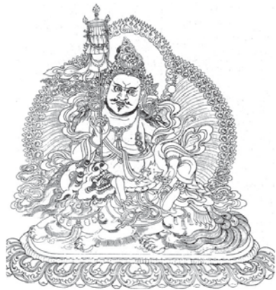
༥ རྒྱལ་ཚེན་རྣམ་མང་ཐོས་སྤྲུལ།

དབང་པས་ལྷ་གས་ཉ་ལྔ་བ་ ༦ ཚེས་ ༡༠ ལ་བྲིས་པའོ།། །།