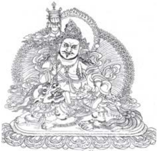
་ རྒྱལ་ཆེན་རྣམ་ཐོས་སྲས།

ཚོགས་རྣམས་ཀུན། །ཚུལ་བཞིན་ཚོ་ག་ལྟོན་པ་ཡིས། །རྣལ་འབྱོར་ ལ་ནི་ཉིར་གནས་མཛོད།། ཞེས་ལན་གསུམ་པོ་མཛོད་དེ། ལྷ་མ་མ་གཏོགས་པའི་མི་ ཏོག་ལས་རིམ་གྱིས་བསྟུ། ལུག་གསུམ་འཚལ་ནས། ལྷ་མ་དང་གཙོ་བོ་ཐ་མི་དང་ པའི་ཞབས་བྱུང་དུ་དགོ་འདུན་རིག་པ་འདྲིན་པ་རྣམས་ཀྱི་རིམ་གཉིས་ ཀྱི་ལྟའི་རྣལ་འབྱོར་ཟབ་མོ་ལ་གནས་པར་ལྷ་བའི་ཡོན་དུ་ཞིང་ཁམས་ འདུལ་བར་ལྷ། བདག་འདུག་རྣམས་སུ་རི་ལྟར་བལྟམས་པ་ཞེས་པའི་ཚོག་མཚམས་ ལྷ་ལྷས་འབུལ། དེ་ནས་མཚོད་དཔོན་ནས་ལུག་གསུམ་འཚལ་ནས་ལྷ་མ་དང་གཙོ་བོ་ཐ་མི་ དང་པའི་ཞབས་བྱུང་དུ་དགོལ་འཁོར་དུ་འདུག་པར་ལྷ་བའི་ཡོན་དུ་མཐུལ་ འདུལ་བ་ལྷ། ་ ལུམ་པའི་ལྷ་རྣམས་ཆགས་པ་ཆེན་པོ་མེར་ལྷ་རྣམས་ དང་། མདུ་ར་ཏ་ཞེས་པའི་རྣམས་སུ་དགོལ་འཁོར་གྱི་ཡོལ་བ་ཤར་སློ་ནས་སྤྱེ་བྱ། རང་ ཉིད་མི་བསྐྱོད་པར་འགྱུར་ཞེས་པའི་རྣམས་སུ་ལས་བུམ་གྱིས་ལྷས་ཚུ་ཚོགས་མང་ལ་འབྲེམ། དེ་བཞིན་གཤེགས་པ་ཐམས་ཅད་ཀྱིས་བྱིན་བྱིས་སྐོ་བས་ཤིག་ཞེས་པའི་མཚམས་ ལྷ་མི་དང་བདུག་རྣམས་ལ་འབྲིགས་བྱ།།