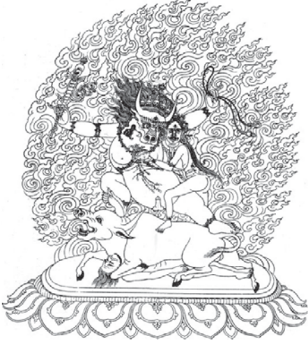
མཇུག་དམ་ཅན་ཚོས་གྱི་རྒྱལ་པོ།

ཚོ། གྲུ་ཚང་འདི་ཉིད་གྱི་གདོད་མའི་འཆར་གཞི་སྣང་མགོང་ས་མཚོག་ དང་སྐྱུ་སྐྱེར་ཡིག་ཚང་དུ་སྐད་རྒྱུད་མ་དགོན་གྲུ་ཚང་འདི་ཉིད་གཙང་ འབྲུལ་ལྷ་རྒྱུ་ཡིན་ན་དེ་དོན་ལག་ལེན་འཁེལ་བའི་ལས་བྱེད་དང་དགོ་ འདུན་ཚང་མའི་ཐུགས་གྱི་དྲིལ་དུ་བཅའ་ཡིག་རིན་པོ་ཆེ་དགོངས་དོན་ ལག་ལེན་སྐྱུ་ས་ལེགས་གནང་སྐྱོད་དགོངས་འཇག་ཟབ་མོ་འཚེལ།། །།