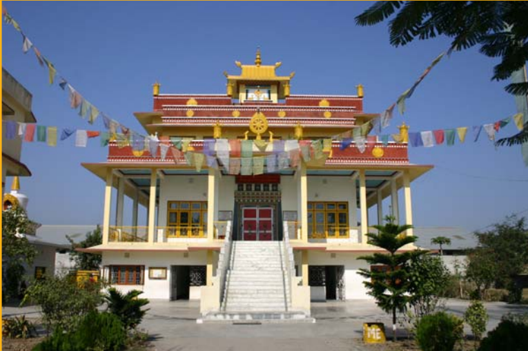
Sed-Gyued Institute of Buddhist Studies (Monastery) Salugara