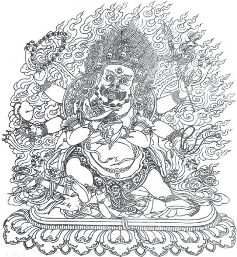
ཎ དཔལ་ཡེ་ཤེས་མགོན་པོ་ཕུག་རྒྱལ་པ།

གཉེན་པོ་སྣོ་བས་བཞི་ཚང་བའི་སྣོ་ནས་བཟགས་པའི་ཐབས་ནི། འཕགས་ པ་སྤྱང་པོ་གསུམ་པ་བསྟེན་པ། མདོ་སྡེ་ཟབ་མོ་ལ་བསྟེན་པ། ཟབ་ མོ་སྤྱང་པ་ཉིད་སྣོ་མ་པ། དེ་བཞིན་གཤེགས་པའི་ཡེ་གི་བརྒྱ་པ་བསྟེན་ པ། མཚན་སྲགས་ལ་བསྟེན་པ་སོགས་བཞུགས་པ་ལས་དེ་ན་དུ་ མཛད་ལགས་ནས་རྒྱུང་བ་བཟགས་པ་ཞིག་བསྐྱུལ་གནང་ཡོང་བ་མཁྲིན། མཁྲིན།།